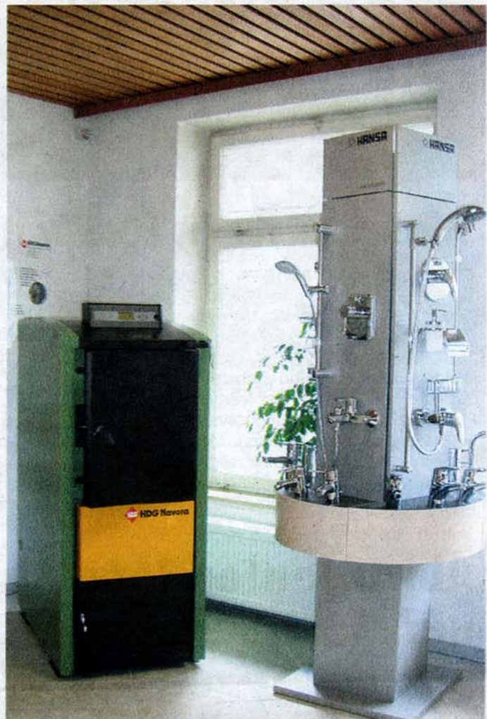
Armaturen und Heizkessel können jetzt in den neuen Räumen besichtigt werden.

sich für den Käufer. Denn: „Wir legen Wert auf Wirtschaftlichkeit und setzen gemeinsam mit unseren Kunden auf fossile und alternative Energien.“ Gerade in der richtigen Beratung liegt eine der Stärken der Dorfbacher Firma. In der weitläufig angelegten Ausstellung kann sich der Kunde als König fühlen. Verschiedene Heizkessel, Solarkollektoren, Armaturen und vieles mehr warten